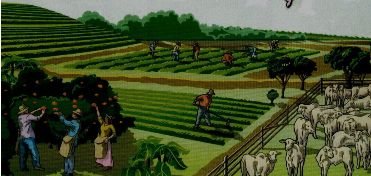
Essa imagem foi pesquisa na Revista Globo Rural, janeiro de 2007, Página 16.