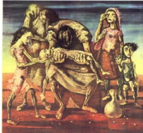
Portinari - Menino Morto 1944/1945