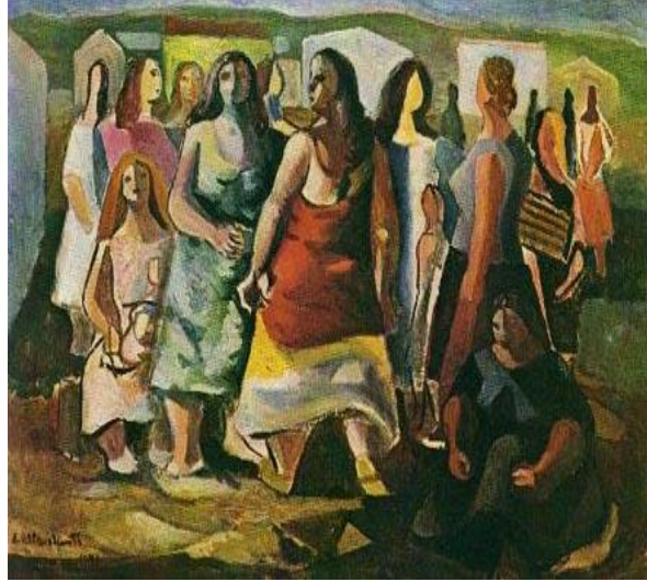
Di Cavalcanti - Mulheres protestando - 1941