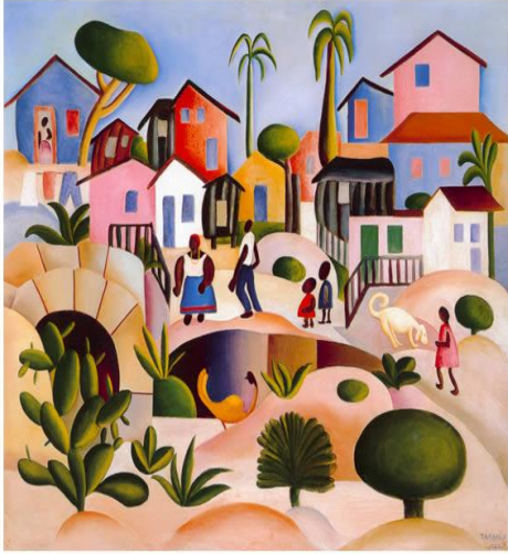
Tarsila do Amaral – Morro da Favela – 1924