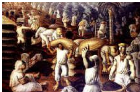
Portinari - Café 1925