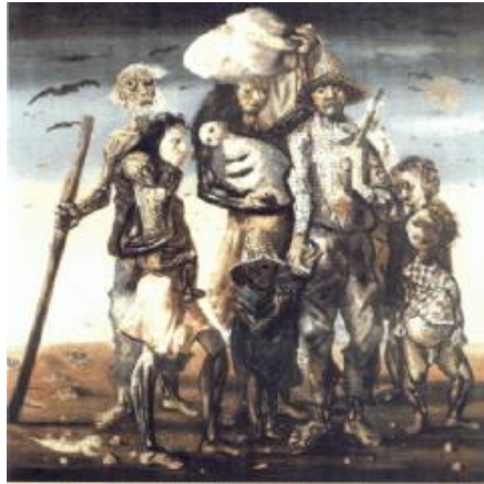
Portinari - Os retirantes 1944