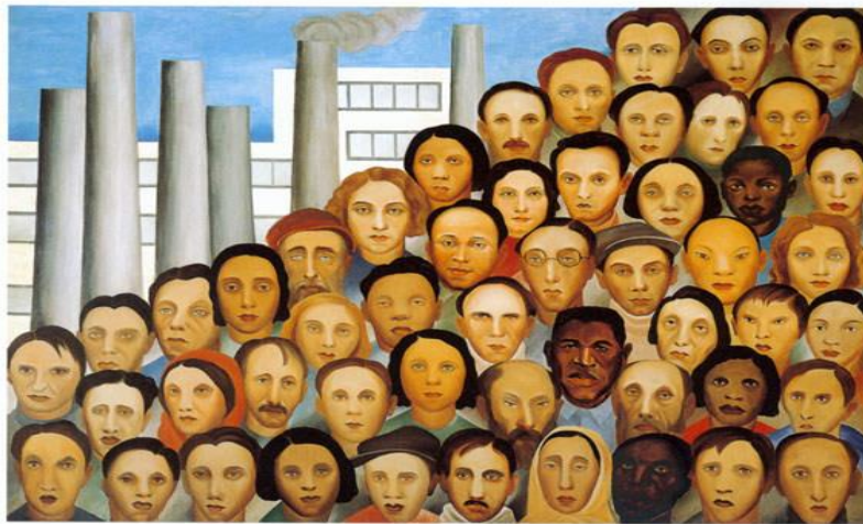
Tarsila do Amaral - Os operários - 1933